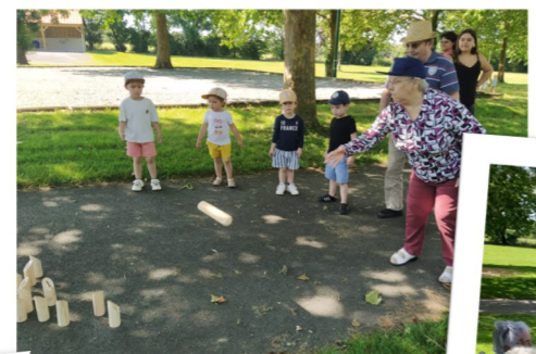
Jeux et pique nique avec Avec les enfants de l'école Notre Dame