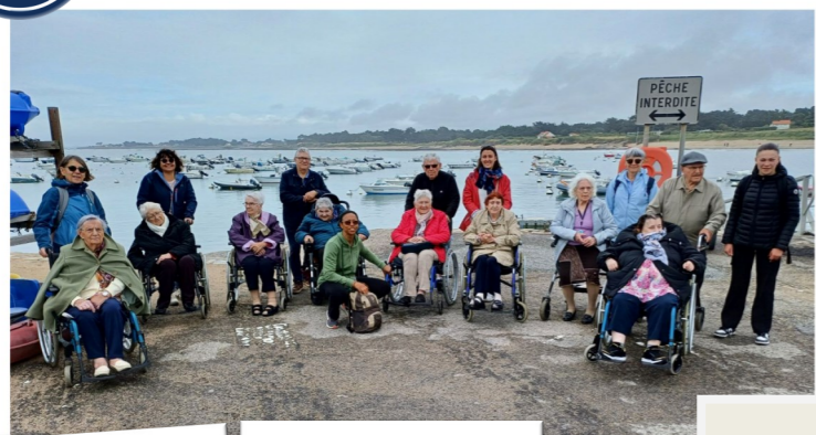
Sortie a la mer